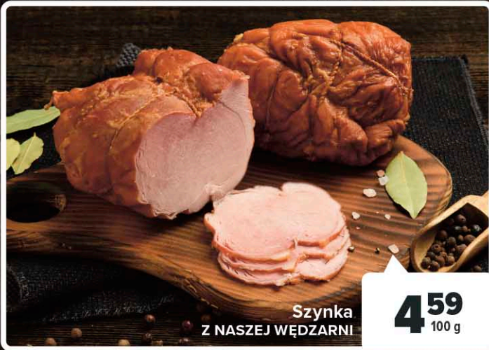
Szynka Z NASZEJ WĘDZARNI