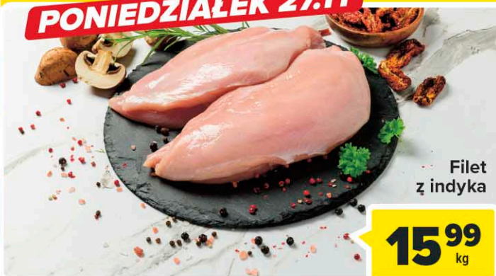
Filet z indyka