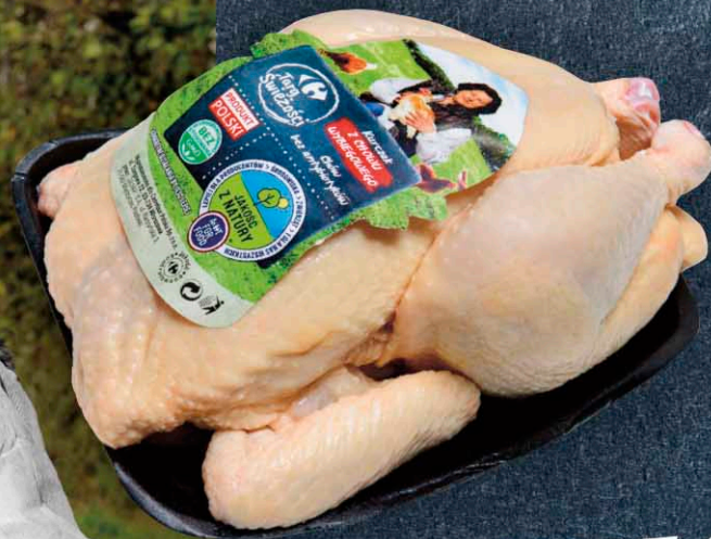
Kurczak z chowu wybiegowego JAKOŚĆ Z NATURY CARREFOUR