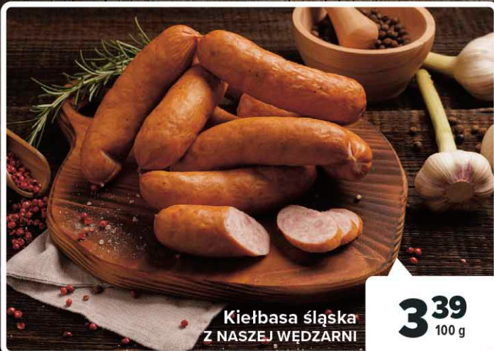
Kielbasa śląska Z NASZEJ WĘDZARNI