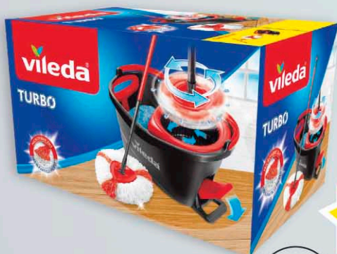
Mop VILEDA TURBO