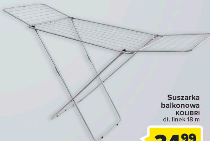
Suszarka balkonowa KOLIBRI dł. linek 18 m