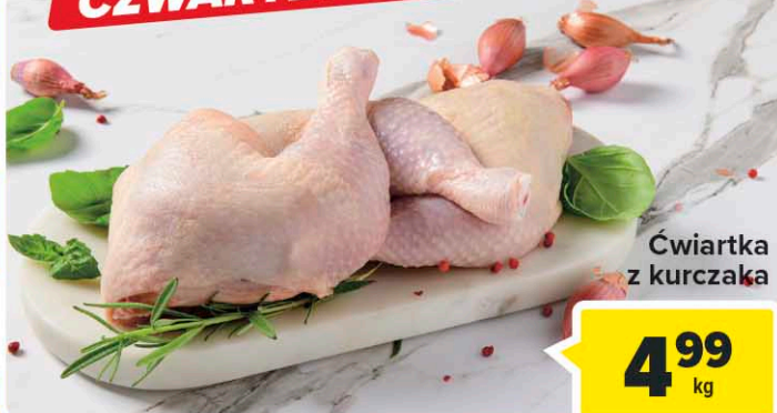
Ćwiartka z kurczaka