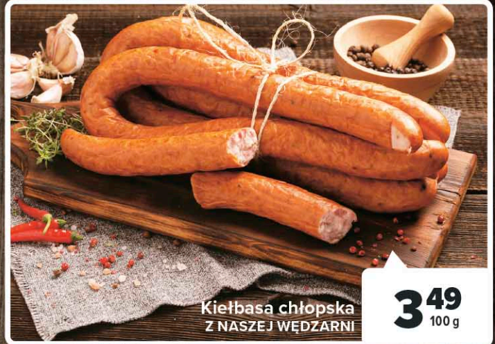
Kielbasa chłopska Z NASZEJ WĘDZARNI