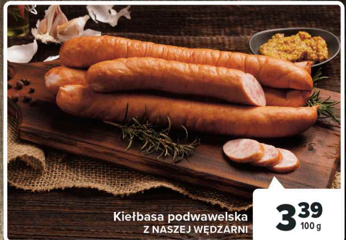
Kielbasa podwawelska Z NASZEJ WĘDZARNI