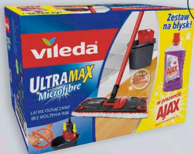
Zestaw mop + wiadro VILEDA ULTRAMAX + Ajax GRATIS!