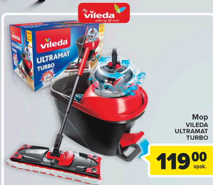
Mop VILEDA ULTRAMAT TURBO

Zrób zakupy za min. 150 zł w terminie 22.11 - 2.12.2023 r.