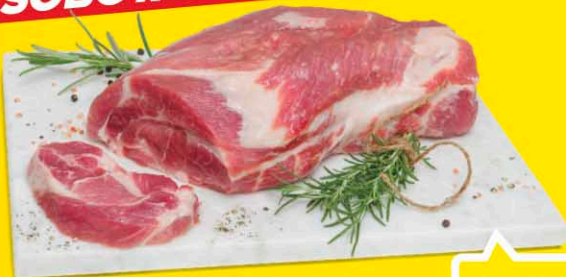
Karkówka wieprzowa bez kości