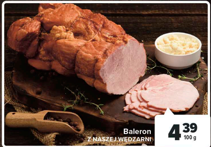
Baleron Z NASZEJ WĘDZARNI