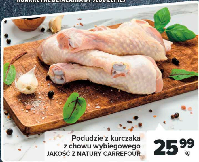
Podudzie z kurczaka z chowu wybiegowego JAKOŚĆ Z NATURY CARREFOUR