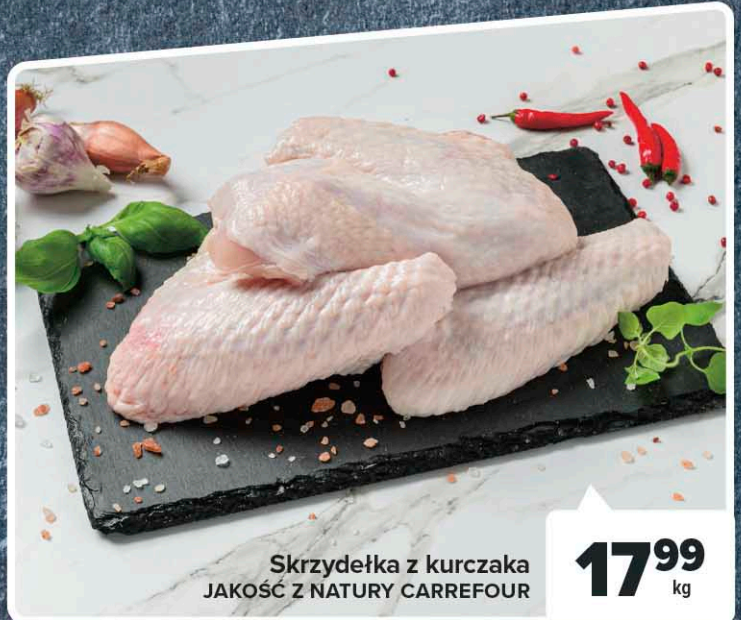
Skrzydółka z kurczaka JAKOŚĆ Z NATURY CARREFOUR