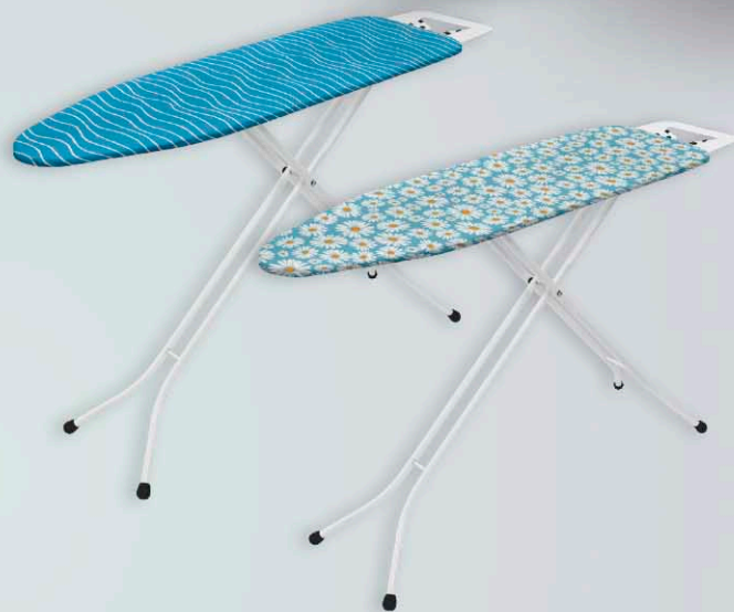
Deska do prasowania BENNY wym. 110 x 130 cm