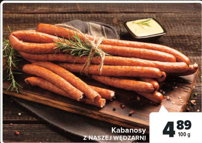
Kabanosy Z NASZEJ WĘDZARNI